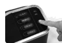
Obr. 7 Zařízení vypnete tlačítkem ON/OFF a přepnutím vypínače