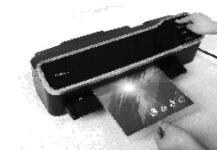
Obr. 6 V případě zaseknutí lam.kapsy vyjměte zaseknutou laminaci ze vstupu, eventuálně problém zařízení shledejte samo a zruší operaci