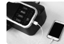
Obr. 8 Připojte Vaše zařízení pomocí USB adaptéru. Laminátor podporuje jak Android, tak iOS.