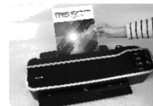
Obr. 5 Vyjměte dokončenou laminaci z výstupu na zadní straně zařízení